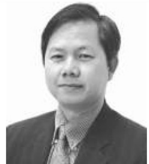
Dr Lee Boon Chye Ahli Parlimen Gopeng