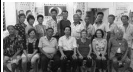
新邦波赖新村支部