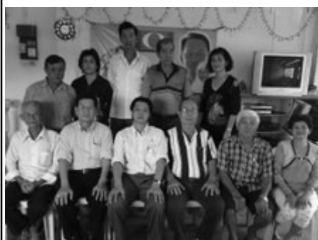
昆仑喇叭新村支部